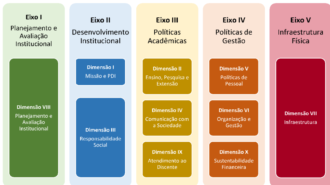
Figura 1 – Eixos e dimensões do SINAES

Essa autoavaliação, realizada em todos os cursos da IES, a cada semestre, de forma quantitativa e qualitativa, atenderá à Lei do Sistema Nacional de Avaliação da Educação Superior (SINAES), nº 10.8601, de 14 de abril de 2004. A legislação irá prever a avaliação de dez dimensões, agrupadas em 5 eixos, conforme ilustra a figura a seguir.