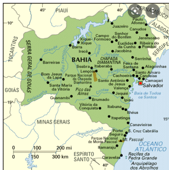
Figura 1 – O Estado da Bahia

O Estado da Bahia possui extensão de 1.065 km coberta por cursos d'água. O principal rio do complexo hidrográfico do Estado da Bahia é o São Francisco, cuja bacia ocupa área de 304.421,4 km². A bacia do São Francisco se estende até o extremo norte do Estado, beneficiando, em seu curso, alguns centros econômicos e parte da sua região semiárida. Outras bacias também importantes pertencem aos rios Itapicuru, Paraguaçu, Contas, Pardo e Jequitinhonha.